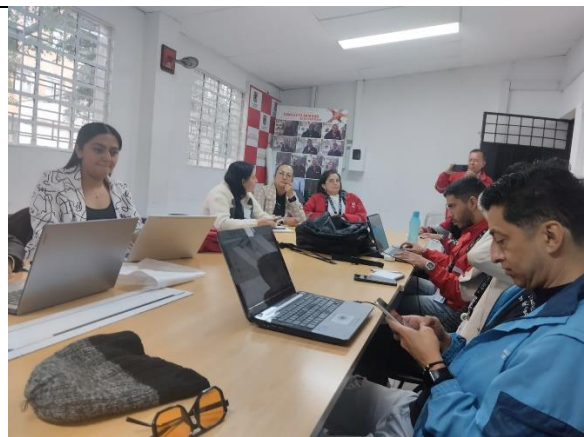
Fotografía 2. Finalización mesa de residuos.